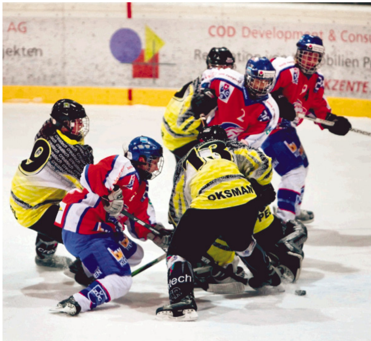
Das erste Halbfinal-Spiel zwischen den ZSC Lions (rot) und Reinach war eine intensive, aber klare Sache.

Die ZSC Lions kommen schliesslich locker zum 7:2-Kanter Sieg. In der Qualifikation gewannen sie gegen Bomo Thun schon mal 19:0. Das zweite Spiel der Best-of-3-Serie findet am Samstag in Reinach statt. Der Finaleinzug ist das Ziel der Lions. Den ersten Playoff-Sieg feiern sie aber nicht ausgelassen.